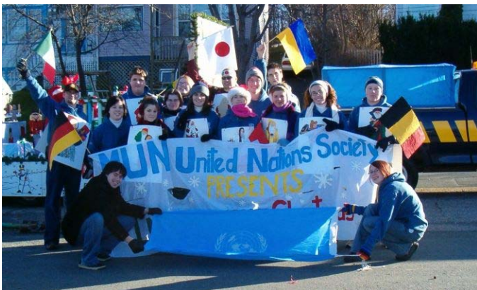
La société pour les Nations Unies de l'Université Memorial

Vancouver, BC - Victoria, BC - Région de Kootenay, BC - Calgary, AB - Edmonton, AB - Saskatoon, SK - Winnipeg, MB - Hamilton, ON - Région de capitale nationale, ON - Région de Quinte, ON - Toronto, ON - Montréal, QC - Québec, QC - Région de Saguenay, QC - St. John's, NL