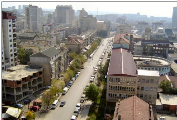
Le centre-ville de Pristina, le cœur de l'activité politique et économique du Kosovo

l'industrie minière pourrait créer jusqu'à 35.000 nouveaux emplois, un investissement substantiel de 1,8 milliards d'euros serait d'abord nécessaire pour développer suffisamment le secteur de l'exploitation minière au Kosovo. Le statut politique encore non défini du Kosovo est un obstacle important à l'injection de capitaux étrangers et l'on peut seulement espérer que la résolution du statut du Kosovo, prévue pour 2006, permettra une augmentation des investissements étrangers et l'obtention de prêts pour le développement qui donneraient un sérieux coup de pouce à l'économie locale.