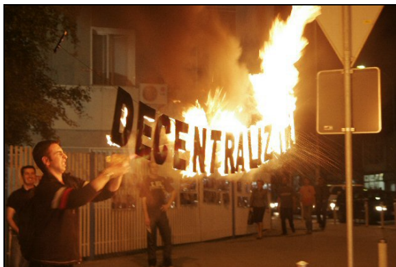
Le brûlant sujet de la décentralisation au Kosovo se révélera peut-être comme le thème décisif au centre des négociations sur le statut final de la province

Certains avancent que le gouvernement serbe est entièrement conscient du fait qu'il ne retrouvera jamais le contrôle effectif de la province. Néanmoins, faisant face à une forte pression nationaliste en Serbie, la plupart des politiciens de Belgrade préféreraient retarder l'accès du Kosovo à l'indépendance plutôt que de l'accepter. Pour résoudre cet imbroglio politique, les Nations unies ont récemment désigné l'Ambassadeur norvégien Kai Eide afin d'évaluer le progrès accompli par le Kosovo dans son effort pour atteindre un ensemble de huit normes identifiées comme conditions préalables à toute décision portant sur le statut final de la province. Établies en décembre 2003, ces normes portent sur des institutions démocratiques qui fonctionnent, l'État de droit, la libre circulation des individus, le processus de retour des réfugiés et la défense des droits des communautés et de leurs membres, l'économie, les droits de propriété, le dialogue et le Corps de protection du Kosovo.