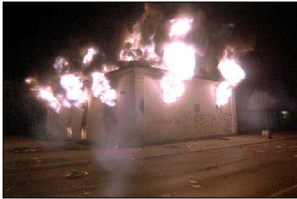
La violence de mars 2004 a laissé des cicatrices qui n'ont pas terminé de se refermer, plus d'un an après

À la mi-mars 2004, trois jours de violentes manifestations anti-serbes portèrent un coup presque fatal aux efforts internationaux destinés à préserver un semblant de société multiethnique au Kosovo. Alors que 50.000 Albanais manifestèrent à travers la province, 19 personnes perdirent la vie, plus de 900 furent blessées, sept villages serbes furent rasés, 800 maisons furent brûlées, 4100 Serbes et non-Albanais furent chassés, et 29 églises et monastères orthodoxes furent détruits.